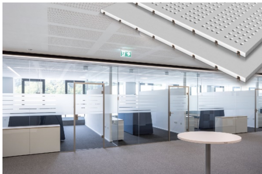
Drei Funktionen, eine Decke: kühlen, heizen, Schall reduzieren.