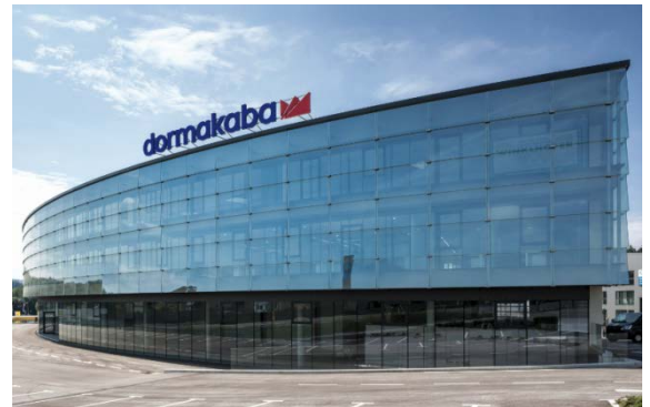
Wohlfühlen auf 1.200 m 2 Bürofläche mit der Variotherm Deckenkühlung und –heizung.

Vor Kurzem übersiedelten rund 100 Mitarbeiter der Firma dormakaba – Experte für zuverlässige Zutritts- und Sicherheitslösungen – von Eugendorf in das innovative Businesscenter in Seekirchen am Wallersee (Salzburg). Sie fühlen sich auf 1.200 m 2 Bürofläche richtig wohl. Und das aus gutem Grund: Der Geräuschpegel wird in den modernen Räumlichkeiten extrem niedrig gehalten. Somit ist ein ungestörter Arbeitsbetrieb möglich. Zu diesen idealen Bedingungen trägt die in Trockenbauweise ausgeführte ModulStandardDecke-Akustik von Variotherm bei, für die sich Johann Schober, Eigentümer der SBI-Schober Bauer Immobilien GmbH entschieden hat. Sie nimmt über ihr ausgeklügeltes Lochmuster und das Akustikvlies einen erheblichen Teil des Umgebungslärms auf und dämpft dadurch den Schall.